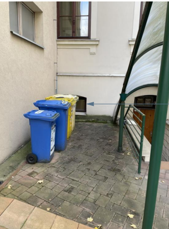
DEMONTÁŽ OKNA A NÁSLEDNÉ ZAZDĚNÍ Z CPP